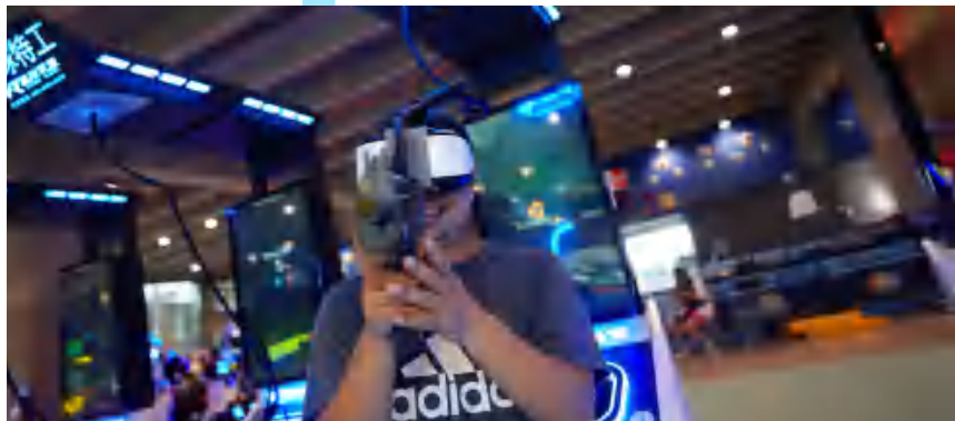
◆广州国际数字体育产业博览会

模拟运动；无人机、格斗机器人、穿梭机、鹰眼技术、快速捕捉摄影摄像、智慧体育场馆、AI/VR/AR裁判等体育赛事应用型技术及设备；电子竞技、陆地冲浪等潮流运动相关装备；潮流文创周边、体育消费品、智能健身、体育/健身内容平台、数字体育运动加盟店/赛事/培训机构等。